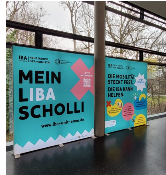
Motiv der IBA-Kampagne, mehr dazu unter Marketing und PR.