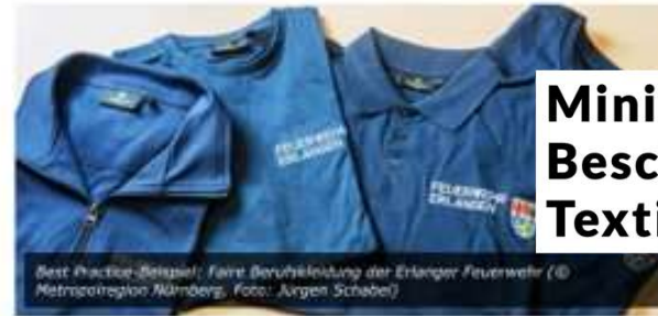
Best Practice-Bispiel: Faire Berufskleidung der Erlanger Feuerwehr

PRESSEMITTEILUNG, VERÖFFENTLICHT VON REDAKTION AM 28. OKTOBER 2020